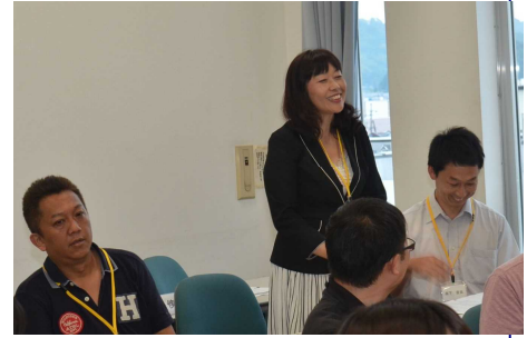
▲OBアドバイザー自己紹介