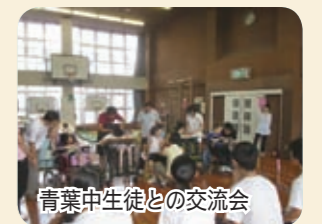
青葉中生徒との交流会