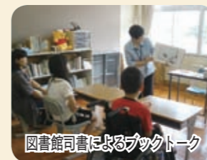
図書館司書によるブックトーク