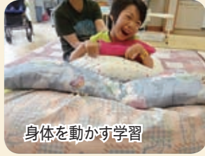
身体を動かす学習