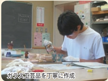
ガラス工芸品を丁寧に作成

高等部生徒の大きな目標の一つに「進路希望の実現」があります。福祉事業所への就労や企業への就労など希望はさまざまですが、どの生徒も働く力を身に付けるために目標を持って学習したり、就労希望先で体験学習や実習に取り組んでいます。また、学習で作った製品・作物などを販売する中で、お客様との接し方も学んでいます。元気で、働く意欲を持った生徒をぜひ応援してください。