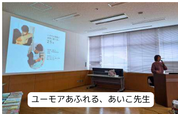
ユーモアあふれる、あいこ先生

ユネスコでは、性教育の国際的な指針として「国際セクシュアリティ教育ガイダンス」で「包括的性教育」の進め方について記しています。この「包括的教育」とは身体や生殖の仕組みだけでなく、人間関係や性の多様性、ジェンダー平等、幸福など、幅広いテーマを含む性教育のことです。まさに「人権を守るため」の性教育ですね。引き続き、フレアス舞鶴でも包括的性教育、その先のジェンダー平等の実現に向けて取り組んでいきたいと思ひます。