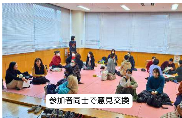
参加者同士で意見交換