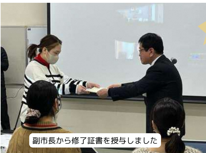
副市長から修了証書を授与しました

受講生の皆さんお疲れ様でした。修了おめでとうございます！！今後の皆さんの輝かしい活躍を期待しています。