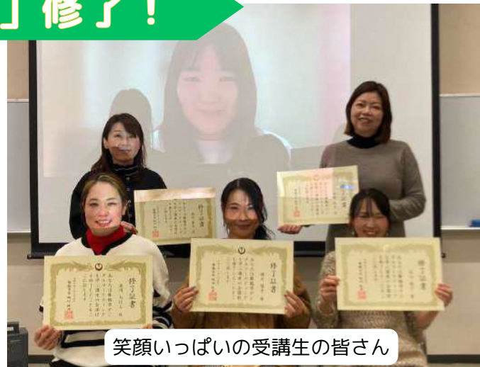
笑顔いっぱいの受講生の皆さん

デジタルマーケティングを学ぶ講座が、心温まる修了式で幕を閉じました。この講座では、昨年9月からの5ヶ月間、10名の受講生たちが、約150時間のオンデマンドでの在宅学習と8回のスクーリングを通じて、デジタルマーケティングのスキルを習得しました。