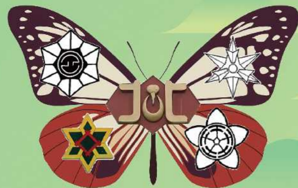
城北中学校区小中一貫教育シンボルマーク