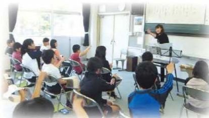
体験入学で中学校の授業を受ける6年生