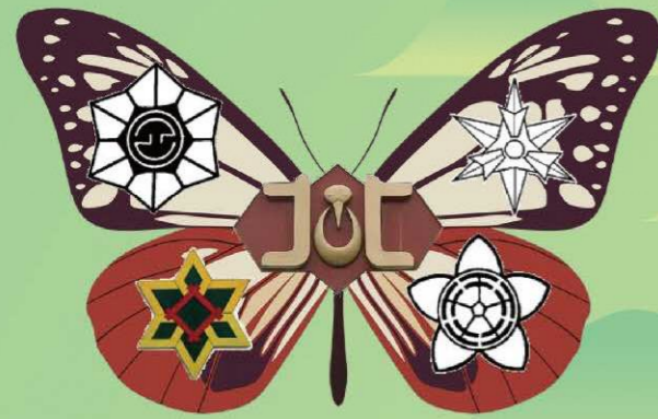
城北中学校区小中一貫教育シンボルマーク