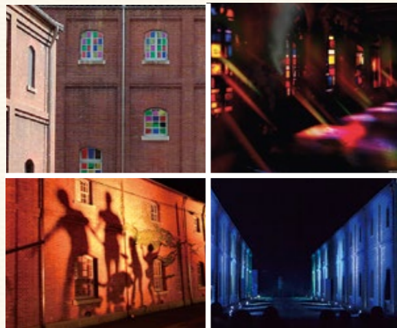
※写真はイメージ。実際のものとは異なります。