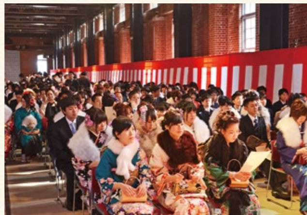
▲式典会場の赤れんが5号棟の様子(1月12日)