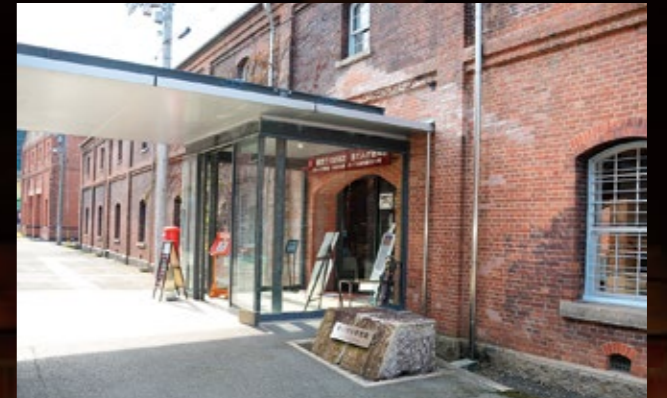
▲特別展が開催される赤れんが3号棟