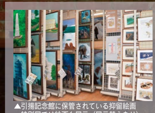
▲引揚記念館に保管されている抑留絵画特別展では絵画も展示(展示替えあり)