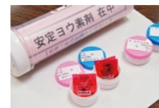
▲配布された安定ヨウ素剤

ヨウ化カリウム（医療用の医薬品）。原子力発電所で事故が起きた際に、放射性ヨウ素による甲状腺の内部被ばくを抑える効果がある。 服用量：13歳以上2丸、3歳以上13歳未満1丸 服用回数：原則1回 有効期限：3年