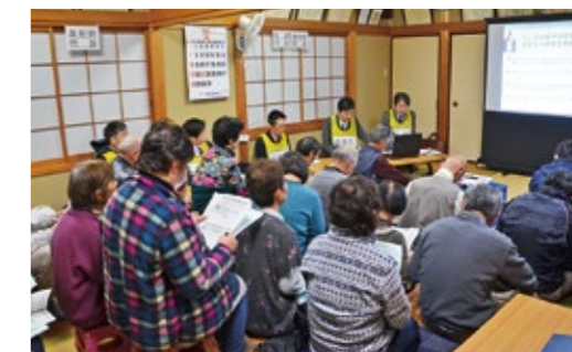
▲説明会の様子（杉山地区）

2地区で開催した事前配布説明会では、府職員や中丹東保健所の医師から安定ヨウ素剤の効果や服用時期・量、副作用、取り扱い方法などを説明。その後、保健師や薬剤師による問診を行い、持病やアレルギーの有無などを確認し、安定ヨウ素剤をお渡ししました。