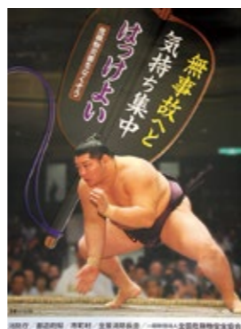
▲キャンペーンポスター