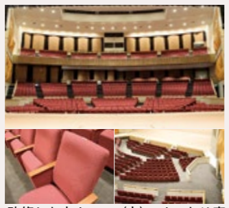
改修した大ホール(上)、ゆったり座れる椅子(左下)、花道への段差を解消(右下)

長寿命化と機能向上を図るため改修していた総合文化会館大ホールの工事が終了。このたびリニューアルオープンします。新しくなった設備は次のとおり。