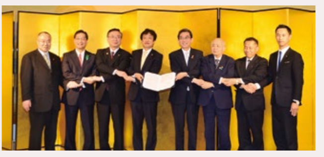
図 企画政策課 (☎ 66・1042)

4月22日、府北部5市2町で「京都府北部地域連携都市圏形成推進」を宣言しました。岡西康博・京都府副知事に出席いただき福知山市で署名式を行い、また、同形成推進協議会を発足し、会長には多々見良三・舞鶴市長が選ばれました(任期は2年)。