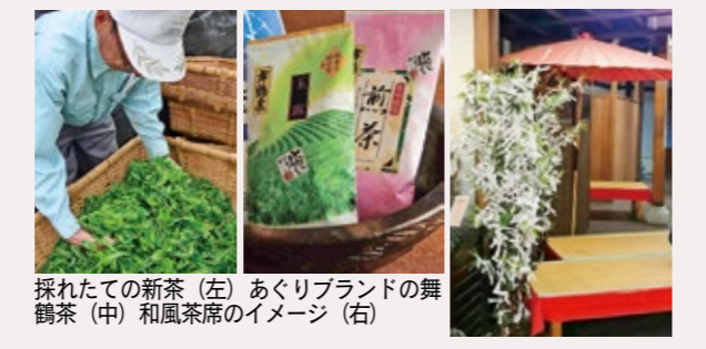
図 農林課 (☎ 66・1023)

全国茶品評会かぶせ茶部門で、3年連続産地賞第1位の実績を誇る舞鶴茶を味わってもらうため、和風茶席を赤れんがパーク内に設置。採れたての新茶を使った新メニューが味わえます。ぜひ一度ご賞味を。