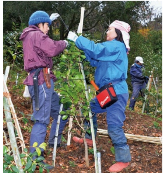
◀竹と縄で若木を守る(12月5日)