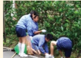
▲加佐中学校生徒会