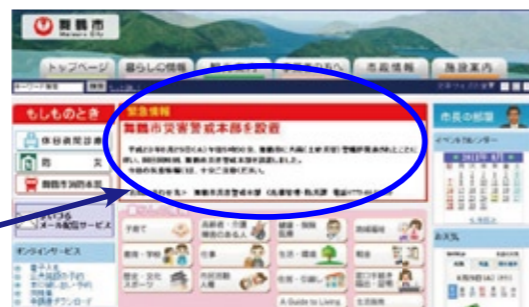
▲市ホームページのトップページ

https://service.sugumail.com/j-maizuru/ バーコードリーダー機能のある携帯電話などをお持ちの方は、左のコードを読み取って登録画面へ。