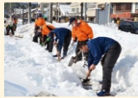
▲海上保安学校学生