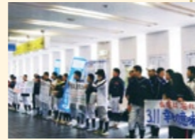
▲日星高等学校生徒会