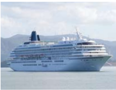
▲京都舞鶴港に飛鳥IIが寄港(9月6日)

11月17日(木)、クルーズ客船「飛鳥II」(全長241m、総トン数50,142ト)が京都舞鶴港に寄港。これに合わせ、市民見学会を開催します。 ◆日時 11月17日、13時30分～14時30分 ◆場所 京都舞鶴港西港第2ふ頭 ◆対象 市内在住の人。ただし、中学生以下は保護者同伴 ◆定員 100人(多数の場合抽選) ◆参加費 無料 ◆申し込み方法 往復はがきに参加者全員の住所、氏名、年齢、電話番号を記入し、みなと振興課へ。はがき1枚につき2人まで(乳幼児は2人まで同伴可)。10月28日(金)消印有効。 詳しくは、同課(☎66・1037)へ。