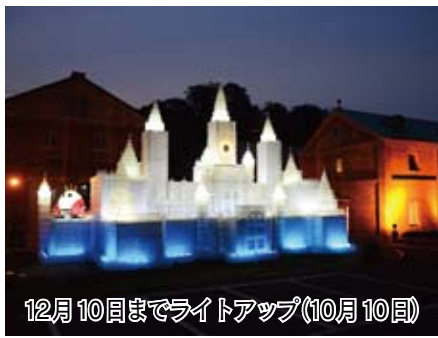
12月10日までライトアップ(10月10日)

「赤れんがアートフェスティバル」の取り組みのひとつである「光のオブジェ」が完成。「光のオブジェ」は、新しい価値の創造をテーマにペットボトル約1万5千本とLED電球約3万個を使用し、約9日、幅約17m、高さ約9m、幅約17m、市民約550人により制作されました。《企画政策課》