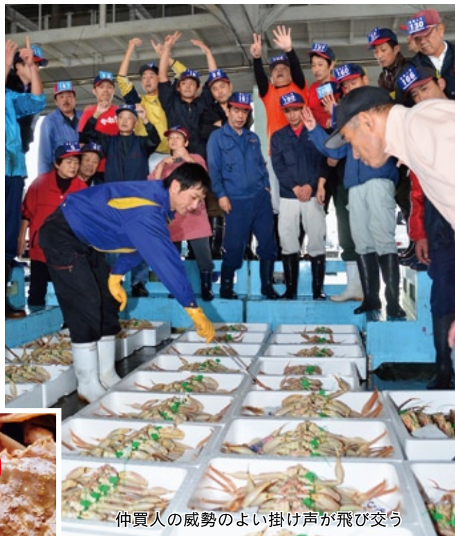
仲買人の威勢のよい掛け声が飛び交う