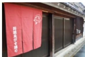
▲町並みを彩るのれん