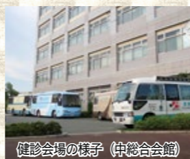
健診会場の様子（中総合会館）

特定健診、胃がん検診、結核・肺がん検診、肝炎ウイルス検診の追加募集を実施。詳しくは、下記のとおり。※特定健診は国民健康保険加入者のみ（無料）