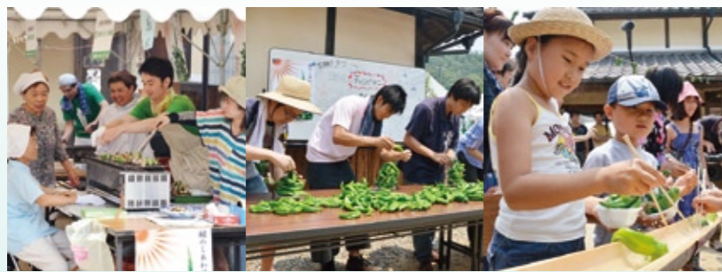
▲万願寺まつり 2012の様子

▼詳しくは、農林課(☎66・1023)へ。 今後は、採用作品を一部加工し、万願寺甘とうの出荷袋や化粧箱へ印刷するほか、横断幕のぼりの作成、ちらしなどに使用し、万願寺甘とうのPRに向けて幅広く活用していきます。 現在キャラクターの名前も募集中です。