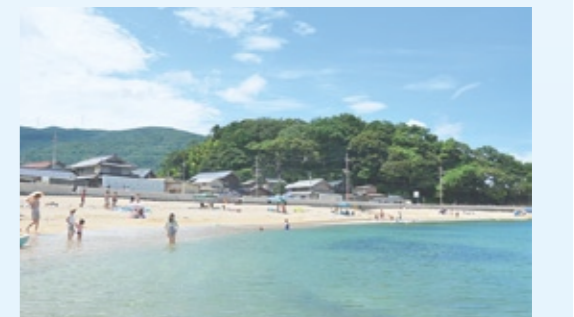
▲竜宮浜海水浴場(昨年の様子)

夏の海水浴シーズンに合わせ、民宿やイベントなどの情報を掲載した「舞鶴海水浴場パンフレット」を作製しました。市内のコンビニ、JR東舞鶴駅観光案内所、まいづる観光ステーションなどで無料配布。市ホームページにも掲載。 今年の夏は水のきれいな舞鶴の海でお楽しみください。 ▼詳しくは、観光商業課(☎66・1024)へ。