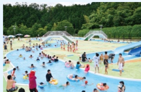
▲文化公園プール(昨年の様子)

文化公園プールを次のとおり開設します。 【期間】 7月20日(土)~8月28日(水) 【時間】 10時~18時 【入場料】 ◆幼児(3歳以上の未就学児)：100円 ◆小・中学生：300円 ◆高校生以上：500円 ▼詳しくは、スポーツ振興課(☎66・1058)へ。