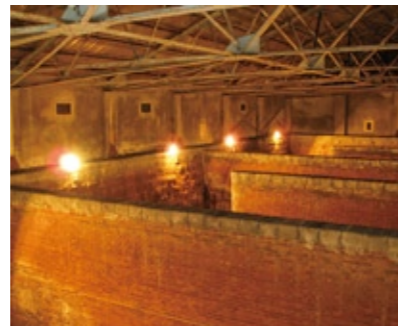
▲旧北吸浄水場施設の第一配水池

旧北吸浄水場施設は、旧日本海軍が明治34年の舞鶴鎮守府開庁に向けて、軍港内の諸施設と艦艇用に大量の飲料水を確保するため建設した施設で、赤れんが造りの上屋を持つ2つの配水池が残されています。 配水池の内部には、高さ5・6㌢の赤れんが造りの導水壁が交互に5列並び圧巻です。 施設付近からは、自衛隊機橋や造船所が眼下に広がり、素晴らしい眺望が楽しめます。この機会にぜひご覧ください。 ▼詳しくは、社会教育課(☎66・1073)へ。