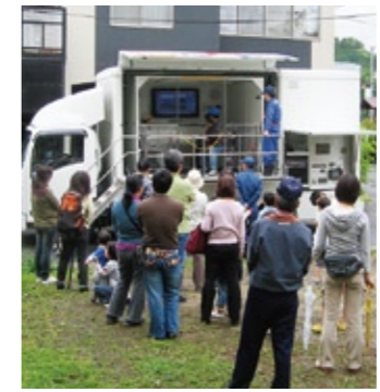
▲起震車で地震体験