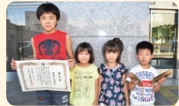
▲黒部子供会の皆さん