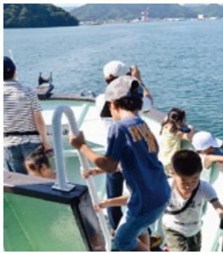
▲舞鶴湾めぐり（昨年の様子）