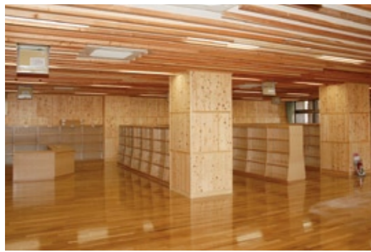
▲舞鶴市産材（学校林）が内装に使われた白糸中学校

市では、舞鶴市産材・丹州材などの京都府産材を積極的に活用し、林業の再生と適切な森林整備を進めるため「舞鶴市公共施設における木材の利用推進に関する基本方針」の策定を進めています。 このたび、素案がまとまりましたので、市パブリック・コメント手続制度に基づき、市民の皆さんから意見を募集します。