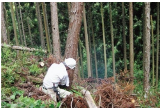
▲森を元気にするための間伐作業（白屋地区）