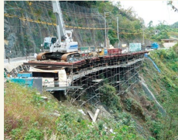
▲橋りょうを用いた拡幅工事(平成24年頃)