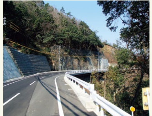
▲2車線化工事が完了した市道野原大山線