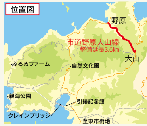
▲赤線部が市道野原大山線

山間部にある同路線の整備については、山側を掘削し、谷側にプロックを設置する工法を基本に進めてきましたが、一部の区間では、本車で初めて谷側に橋りょうをかける工法を採用しています。