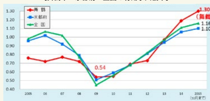
【舞鶴市・京都府・全国の有効求人倍率】

事前に実施したアンケートによると、「舞鶴に住みたくない」と思う理由の中で「舞鶴にはやりたい仕事がないから」が、最も多い意見でした。