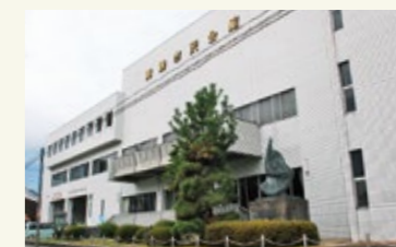
▲文化の拠点として利用されてきた市民会館

昭和43年の開館以来、文化・芸術の拠点として利用してきた「市民会館」を2月末で閉館し、併設する西公民館と郷土資料館は西総合会館内に移転します。