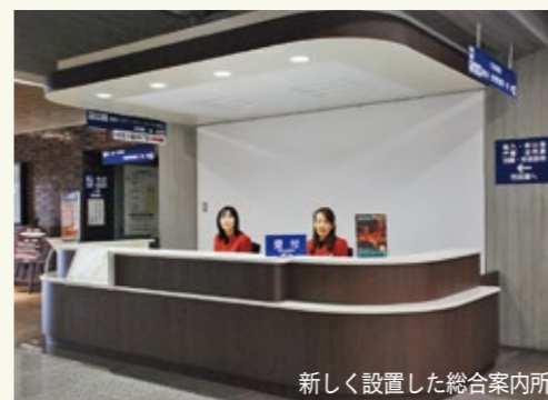
新しく設置した総合案内所

市役所本庁舎の利便性を高めるため、昨年8月から実施していた利用窓口の再配置に伴う改修工事が12月末で完了しました。