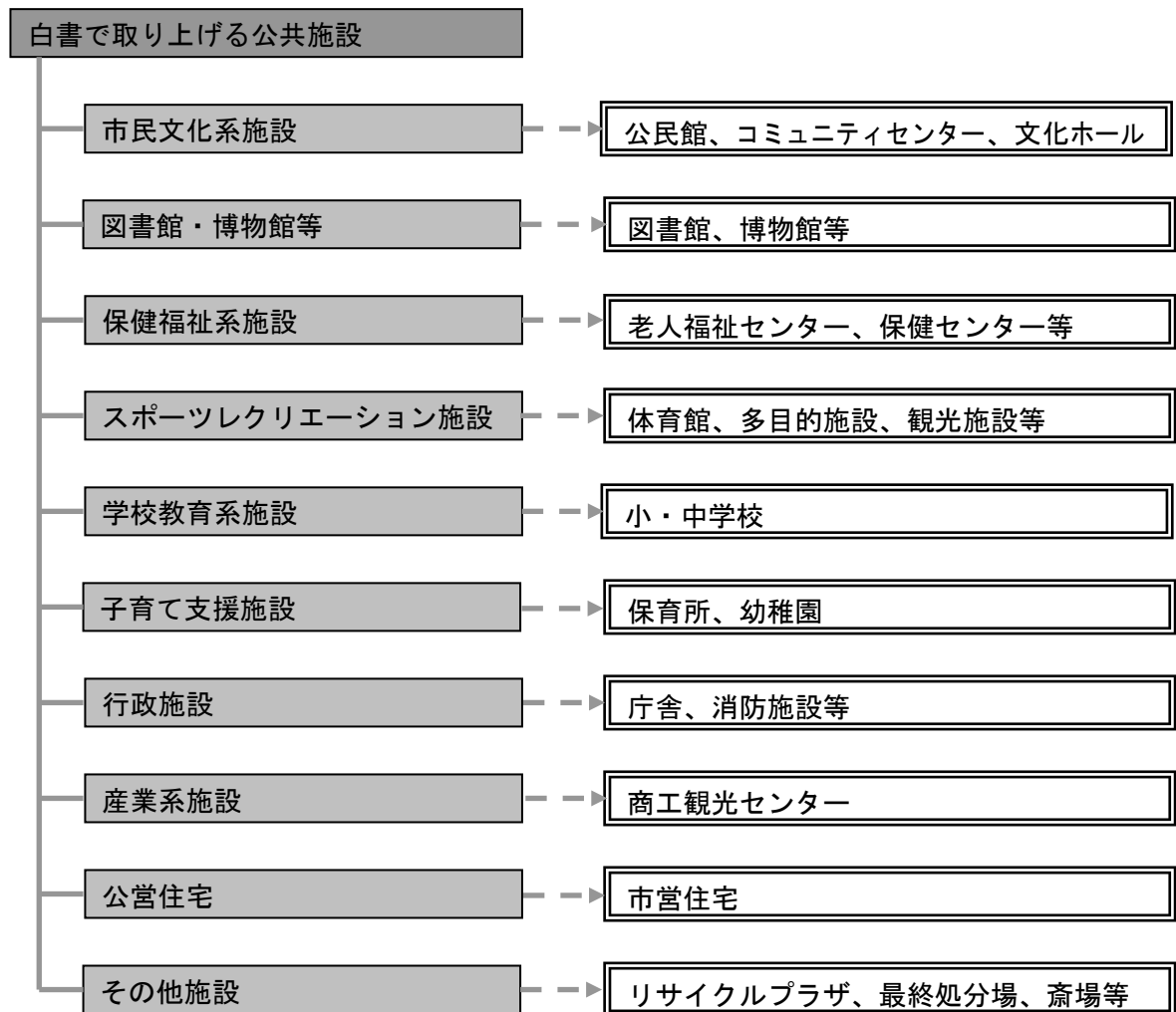
図 対象とした公共施設の分類及び名称

※本白書で扱った保有施設の名称や規模は、原則として2012年(平成24年)4月1日時点の資料に基づいています。