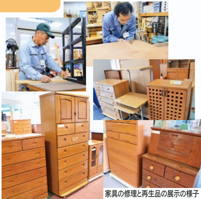
家具の修理と再生品の展示の様子