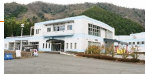
リサイクルプラザ(☎64・7222)

リサイクルプラザでは、リユース(ひとつのものを大切に、くり返し使うこと)を啓発するため、さまざまな取り組みを行なっています。ぜひご活用ください。