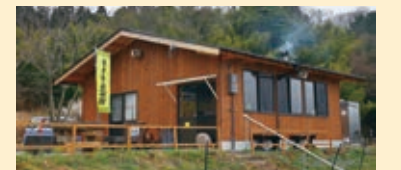
▲3月13日にオープンした名水杉山菜房

農水産物の高付加価値化を図るため、6次産業化推進アドバイザーを設置し、新たな加工品づくりや販売拡大などに取り組み農漁家や業者などを支援。