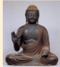
▲阿彌陀如来坐像 (快慶作・松尾寺)