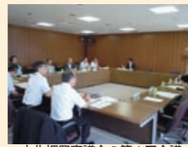
▲文化振興審議会の第1回会議 (7月7日)

市では、今年4月に施行した舞鶴市文化振興条例に基づき、市の文化振興施策を幅広い立場や専門的な視点から審議するために文化振興審議会を設置。7月7日、市役所本庁で第1回会議が開催されました。同会は文化関係団体の構