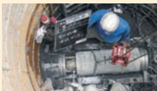
▲最優秀施工者の工事の様子