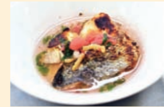
▲冷凍切り身を使った料理

市では、「舞鶴のさかな」を市民の皆さんにもっと食べていただくために、(一社)舞鶴市水産協会の協力で、府漁協舞鶴地方卸売市場で取り引きされた「舞鶴のさかな」の冷凍切り身を、市内の料理教室へ安価で提供する取り組みを行っています。