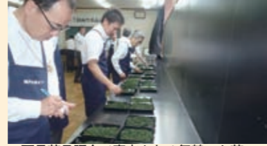
▲両丹茶品評会で審査される舞鶴のお茶

両丹茶品評会 (6月23日、綾部市) と京都府茶品評会 (7月5・6日、宇治市) が行われました。8月には全国茶品評会が三重県で開催され、入賞者は「全国お茶まつり三重県大会」で発表。この全国茶品評会では4年連続産地賞1位を獲得しており、5年連続を目指して本市からも多数出品が予定されています。