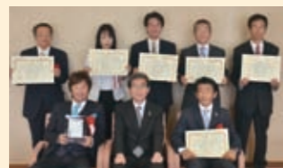
▲表彰された施工者の皆さん