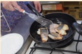
▲提供された冷凍切り身