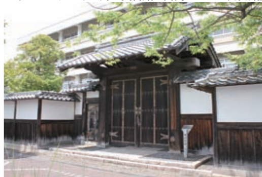
▲新たに市の文化財に指定された「明倫小学校正門」

展示スペース「抑留生活体験室」の整備や約1,300点の所蔵絵画を活用する「企画（絵画）展示室」と「収蔵庫」を増築する2期工事の着手を目指していきます。