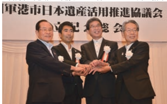
▲旧軍港市（横須賀・呉・佐世保・舞鶴）で連携

どの特徴ある祭礼芸能や伝統行事も引き継がれています。市では、これら誇るべき歴史文化遺産を総合的に保存・活用し、これらを活かしたまちづくりを推進するため、「舞鶴市歴史文化基本構想」を策定する取り組みを進めています。「歴史文化の魅力を探り、学び、活かす」「引き継ぐ」を基本理念とした新たなまちづくりの指針となります。「舞鶴モデル」を創造していきます。