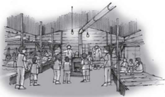
▲第2期整備工事の抑留生活体験室のイメージ

の分科会（国際委員会）などの関連事業や平和学習として全国から教育旅行の誘致活動などに積極的に取り組み、引き揚げとシベリア抑留の史実を世界、そして未来へと継承する国際的・学術的な拠点施設としての役割を担っていきます。