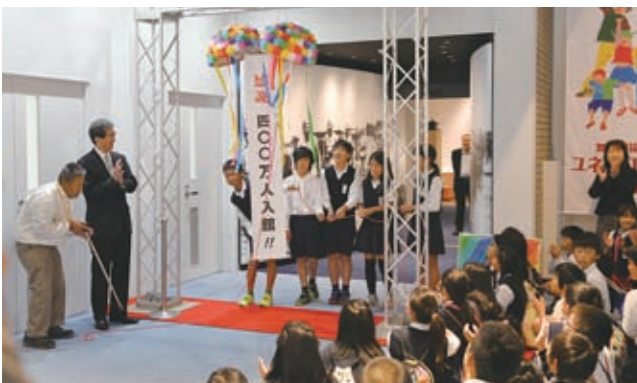
▲引揚記念館の入館者が400万人を達成（昨年10月13日）