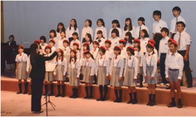
▲世界記憶遺産登録1周年記念フォーラムを開催（昨年10月15日）