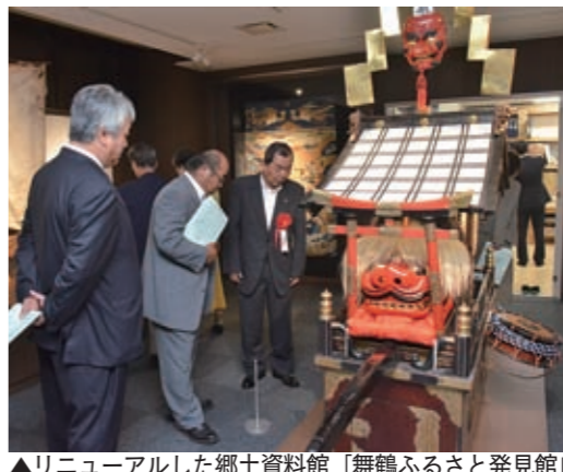
▲リニューアルした郷土資料館「舞鶴ふるさと発見館」

引揚記念館は、平成27年9月にリニューアルオープンし、同年10月のユネスコ世界記憶遺産の登録も相まって、平成27年度には入館者が約13万2千人と、市直営となった平成24年度の約6万9千人から約2倍に増加。また、昭和63年の開館以来の通算入館者数が、平成28年10月には400万人を超えたところです。引き続き、若い世代も当時の過酷な労苦を実感できる空間