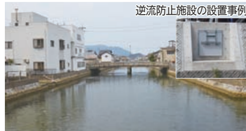
逆流防止施設の設置事例

高野川から市街地への逆流を防止する施設を整備。また、宅地のかさ上げ費用や家庭用の雨水貯留施設の設置費用を助成