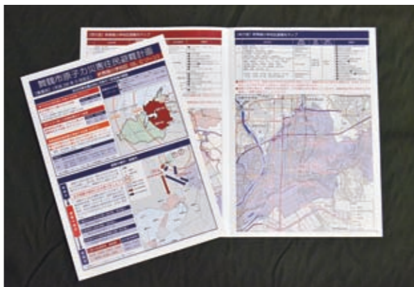
▲原子力災害住民避難計画【概要版】

昨年3月に全面改正した「原子力災害住民避難計画」について、市民の皆さんに、より理解を深めていただくため、避難先や避難の方法などを小学校区ごとにまとめた「原子力災害住民避難計画【概要版】（18種類、A4判フルカラー）」を作製しました。 お住まいの小学校区の概要版を4月中旬から自治会を通じて各世帯へ配布しています。