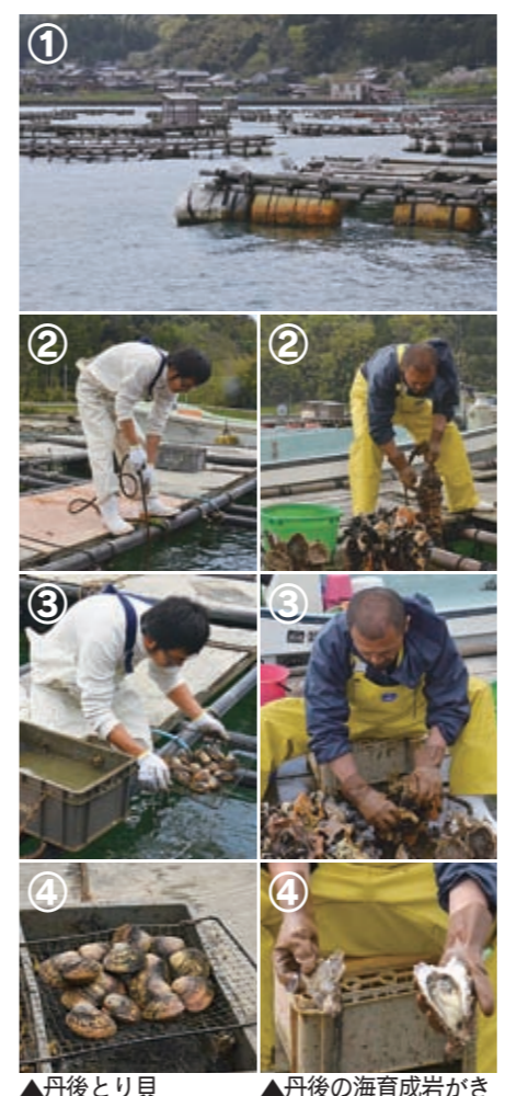
▲丹後とり貝 ▲丹後の海育成岩がき

皆「育てる漁業」で育てられている魚介類にはどんなものがあるか知っておるか。タイやブリは有名じゃから知っておるのう。じゃが、舞鶴の漁師さんは、これは育てておらん。今、旬を迎えておるトリガイやイワガキなどの貝類を主に育てておるんじや。その方法は、左の写真のようになっている。 ① 波の穏やかな舞鶴湾に、木や樹脂製のパイプと浮きで筏を作る。 ② 筏からトリガイを育てる箱やイワガキの赤ちゃんが付いたホタテ貝の殻をロープに付けて海の中につるす。 ③ 掃除や選別を繰り返す。 ④ トリガイは約1年。イワガキは約3年育てられたものを出荷する。