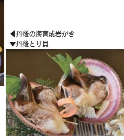
◀丹後の海育成岩がき ▼丹後とり貝

肝心の話をしよう。すこし高価な食べ物じゃが、わしは今年ももう食べたぞ。丹後とり貝は普通のトリガイよりも、身が一回り以上大きく、肉厚で、なんとも言えぬ甘みと旨みがたまらなかつたわい。丹後の海育成岩がきは、天然よりも濃厚でクリーミーな味わいが口いっぱい広がって幸せじゃったなあ。「海のミルク」とはよく言ったもんじや。舞鶴の自慢の逸品じゃ。舞鶴の人にはもちろん、ぜひ、日本全国の人にも味わって欲しいのお。