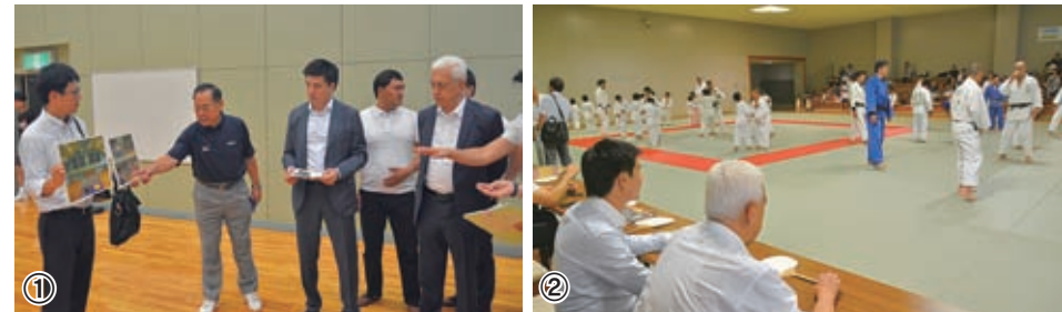
①市関係者からアリーナの説明を受ける ②柔道場と練習を視察 ③舞鶴レスリングクラブの練習を視察 ④南公民館で記念撮影 ⑤引揚記念館で大漁旗進呈

2020年東京五輪において、本市でのレスリングと柔道の事前合宿が内定している中央アジアのウズベキスタンから事前視察団が8月6・7日、本市を訪れました。視察団は、同国のルスタム・クルパノフ体育スポーツ大臣、オイ