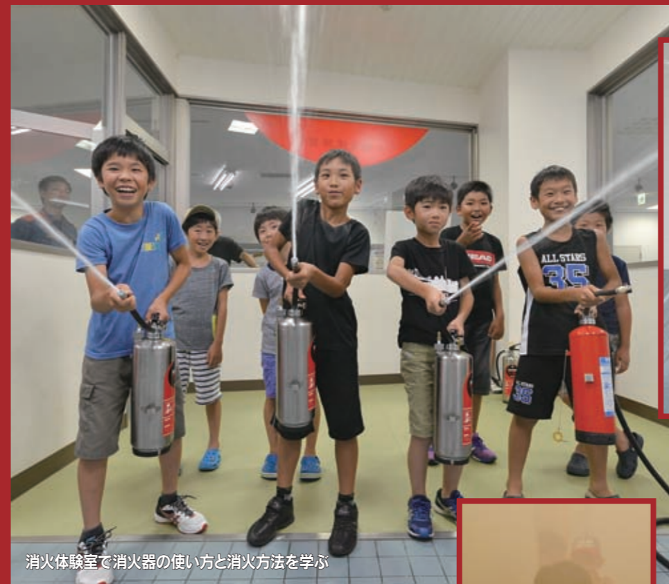
消火体験室で消火器の使い方と消火方法を学ぶ