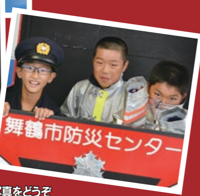
消防の服装で記念写真をどうぞ