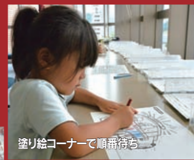
塗り絵コーナーで順番待ち