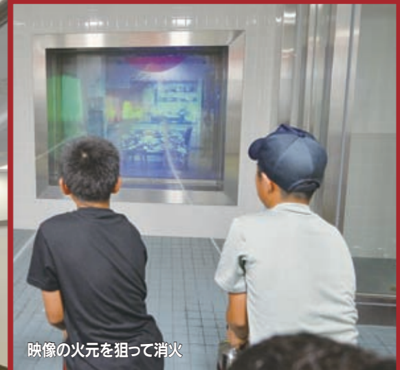
映像の火元を狙って消火