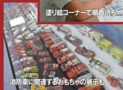
消防車に関連するおもちゃの展示も