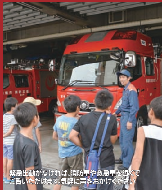
緊急出動がなければ、消防車や救急車を近くでご覧いただけます。気軽に声をおかけください

【内容】 過去、舞鶴市で発生した大規模な水害の被害状況を写真やデータで展示。河川の氾濫や土砂災害の規模を紹介することで、災害への認識を深めていただけます。