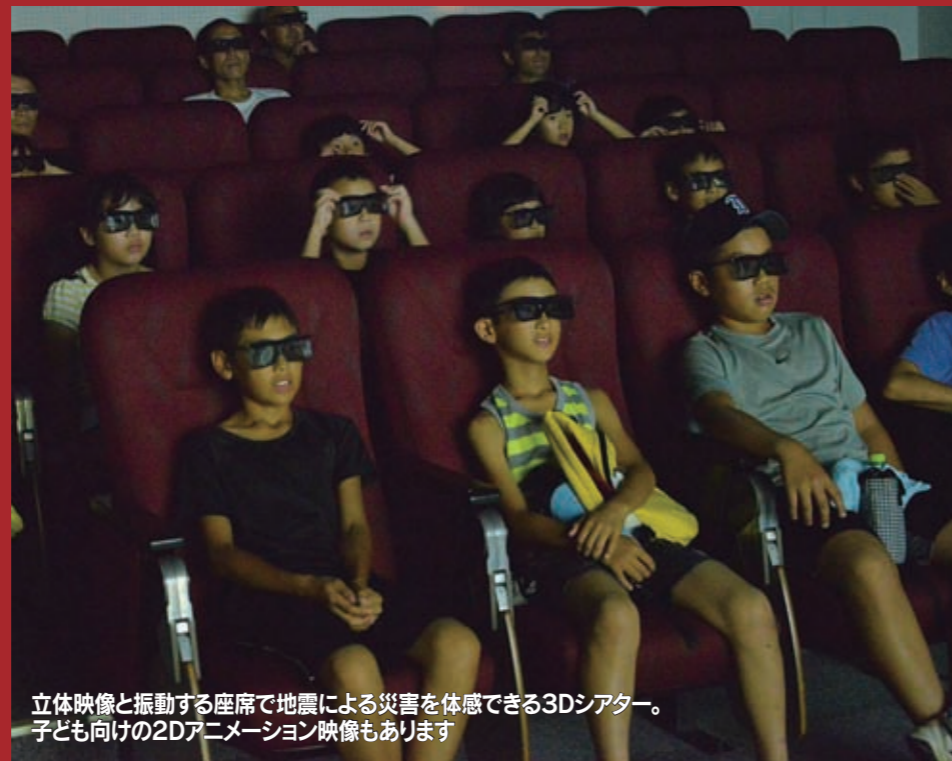
立体映像と振動する座席で地震による災害を体感できる3Dシアター。子ども向けの2Dアニメーション映像もあります