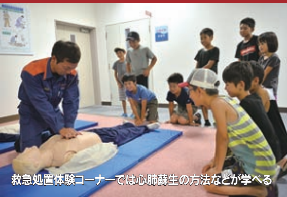
救急処置体験コーナーでは心肺蘇生の方法などが学べる