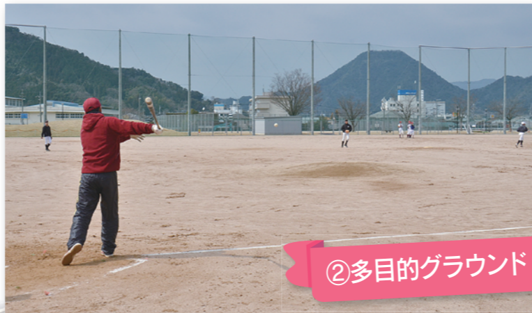
②多目的グラウンド

園内には府北部では初めてとなるフルサイズのサッカー場として利用できる人工芝グラウンド(9,300平方メートル)をはじめ、土の多目的グラウンド