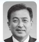
公明党議員団 松田弘幸