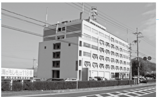
海に関する国の機関が集まる舞鶴港湾合同庁舎

答弁 現在、国が掲げる地方創生の取り組みにおいては、地域の実態把握が重要視されているところであり、その推進に際し海上自衛隊、海上保安本部などにもご協力いただき、まちづくりに対する各種調査を行うとともに「舞鶴に赴任したい」と思っていただけではない、まちづくりを進めてまいりたい。