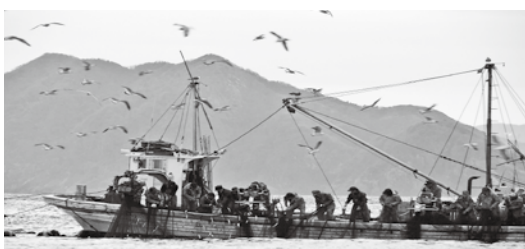
田井地区の定置網漁

究機関として、海の民学舎が設立された。修了生が漁業に従事し、定着してもらうためには支援が必要であるが、市の考えは。 答弁 相談窓口機能の充実や空き家の紹介・空き家改修などの助成による漁業就業と定住の支援、さらには自営漁業の経営を開始する時の初期設備導入などの支援を検討する。