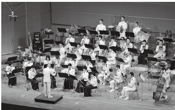
海上自衛隊舞鶴音楽隊と海上保安庁音楽隊のジョイントコンサート

また、平成16年の台風23号災害時におけるヘリなどによる災害者の救出や、平成24年の豪雪の際の雪かきボランティアなど、災害時において迅速にご活躍いただき、市民と地域社会の安全・安心の確保に多大なご尽力をいただいている。市としては、今後とも、舞鶴市民が自衛隊に寄せる信頼や理解を基礎とし、自衛隊舞鶴基地とのさらなる共存関係の充実に努めてまいりたい。