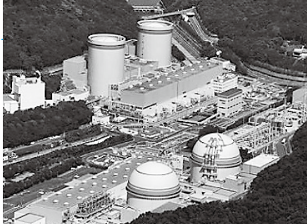
再稼働が迫る高浜原発3・4号機(手前)

連協議会が実施されたアンケートで、町内会の課題が浮き彫りになった。市はこれにどう対応していくのか。また自治会振興交付金を増額する考えはないか。 答弁 課題が多いと再認識した。自主的な活動促進に取り組んでいく。交付金の増額は考えていない。