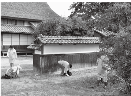
上野家周辺のボランティア清掃

答弁 ポイントを付与する管理機関の選定、介護事業所との調整や公平性などもあることから研究課題としてま