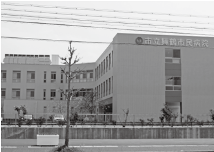
市立舞鶴市民病院

答弁 各商店の戸別訪問で情報収集や意見交換、融資補助制度などの説明を行っている。