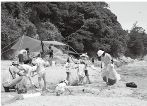
海水浴場などのごみ回収

舞鶴市一般職の任期付職員採用等に関する条例制定は、これまでの臨時職員の立場をさらに明確にするものであり賛成する。