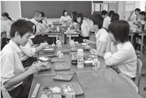
城北中学校の学校給食

第94号議案の条例制定では、舞鶴市休日急病診療所設置に伴い、施設の適正な運営のために制定されるものであり、市民の皆さんが安心して休日に診察を受けていただけるようご尽力いただきたいと要望し、全議案に賛成する。