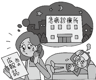
求められる休日夜間診療

ず、夜間を削除した理由、事情はいまだ市民に明確にされていない。当初の計画には、なぜ夜間が盛り込まれていたのか、その経緯を丁寧に、市民に分かりやすく説明すべきである。本来、市民のためになる診療所とは、昼夜を問わず、いつでも誰でも安心して受診できることが大前提であると考えることから、診療所の開設後は舞鶴市の責任において早期に「夜間」診療への拡大を強く求めるものである。