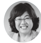
日本共産党議員団 伊田悦子