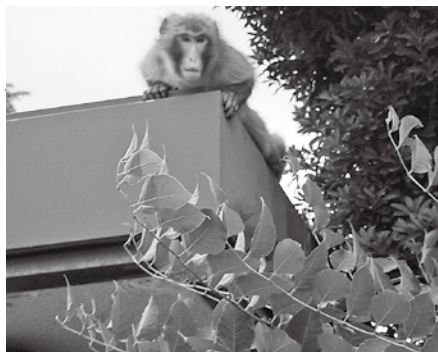
市街地に出没したサル

問でも要望していた。このたび大江町に3市共同で利用する焼却施設が整備され、これに合わせて効率的に処理、運用するため、施設に搬入するまでの一時保管庫を市内3カ所に整備するもので賛成する。同じく有害鳥獣被害防止対策事業費で捕獲報償費580万円が追加計上された。被害の軽減を図る最も有効な手段は個体数を減少させること。今後も農家の生産意欲向上のため「捕獲」、「防除」両面になお一層の対策をお願いしたい。