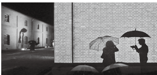
赤れんがパークのイルミネーション

答弁 来年、戦後引き揚げ70年の年に、ユネスコ世界記憶遺産の登録発表や10月のリ