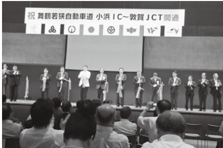
舞鶴若狭自動車道の開通式典 (福井県美浜町総合体育館)

26年7月舞鶴若狭道と27年春の京都縦貫道の全線開通により、近畿を周回できる高速道路網が完成し、人・物の流れが大きく変わる。この好機を逃すことなく舞鶴観光ブランドプロモーション戦略を強く押し進め、活力あるまちづくりを期待する。