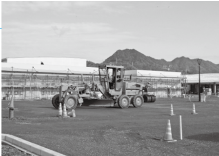
工事が進む子育て交流施設

応じることができる体制となるよう準備を進めている。子どもが、主体的・自発的に、五感を使い、自分の持つ可能性を引き出し育っていきけるような「豊かな遊び」を提供するため、多数の遊び方を準備する予定である。開館に向けては、竣工を27年3月末に行い、4月下旬のオープンで、準備を進めている。