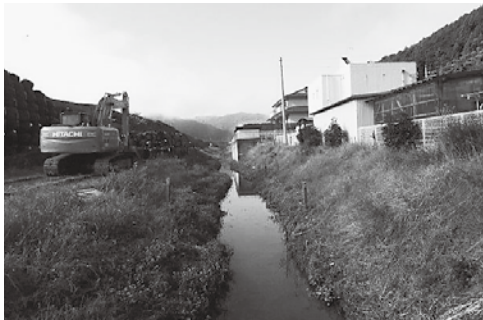
工事中の輪中堤と大排水路

ただけるように、「大江線」に接続しやすいダイヤに改正し、1月5日(月)から実施したい。