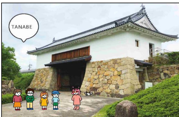
(3) ( ) 城跡地 あとち