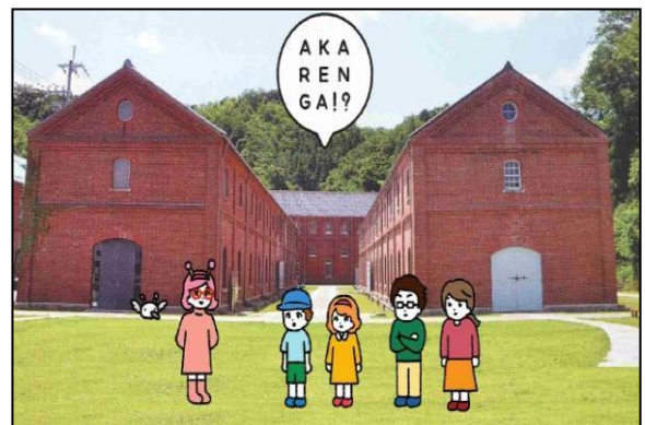
(2) まいづる ( ) パーク