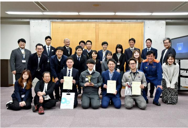
▲kintone アプリ甲子園の結果発表後

令和6年2月19日には福知山市、南丹市、高浜町にも参加してもらい、業務改善の手法をプレゼンするイベント「kintone アプリ甲子園」を開催しました。10分間で資料や実際のkintoneアプリを使って業務改善の腕を競いました。イベントやkintoneをきっかけに職員間のコミュニケーションが増加。また市外の職員とのつながりもでき、幅広い活用事例を共有することができました。