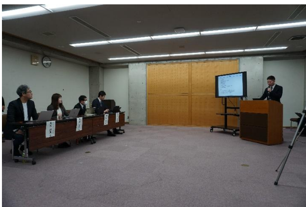
▲昨年のアプリ甲子園でのプレゼンの様子

※kintone (キントーン) とは…サイボウズ㈱が開発しているノーコード・ローコードツール。ドラッグ&ドロップだけで簡単に、自分たちで業務アプリを作ることができます。