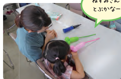
ねずみさん とぶかなー