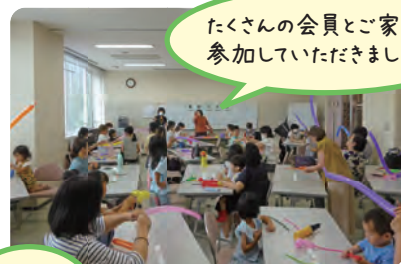
たくさんの会員とご家族に参加していただきました！

毎年恒例の「ファミサポクリスマス交流会」は、会場の都合で今年は開催できません。来年の2月～3月頃にイベントを考えていますので、楽しみにしててください(^ ^)／