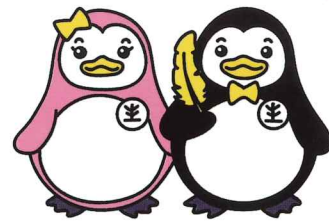
更生ペンギンの サラちゃん