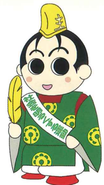
“社会を明るくする運動” 京都府推進委員会マスコット キャラクター京の社明くん

社会を明るくする運動は、すべての国民が、犯罪や非行の防止と犯罪や非行をした人たちの更生について理解を深め、それぞれの立場において力を合わせ、犯罪や非行のない安全で安心な明るい地域社会を築くための全国的な運動で、今年で75回目を迎えます。