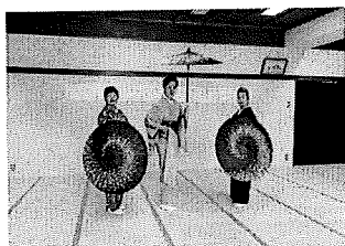
金曜日 大広間 豊美恵会様