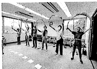
会議室 どんぐりころころ様