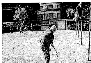
木曜日 屋外運動場 加佐デイサービスセンター いきいき倶楽部様