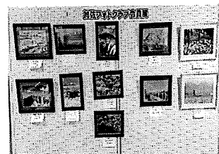
2階ロビー 加佐フォトクラブ様