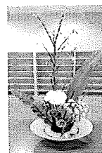
作品は玄関ロビー で展示中