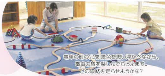
電車の町の完成！景色を思い浮かべながら、 電車の旅を楽しんでもらえます。 どの線路を走らせようかな？