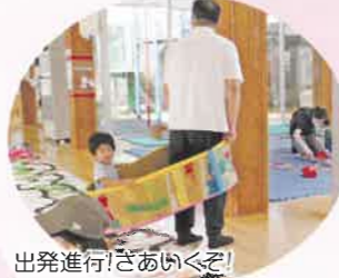
出発進行！さあいくぞ！ 線路のようなものは、乳児体験 プログラム「えのくとあそぼう」の 作品を使っています。