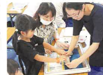
シルクスクリーン