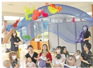
0歳プログラム 「めのおあそび」

乳児とその保護者を対象に、五感を使ったあそびの体験をとおして、親子の触れ合いを深めるプログラムを開催！ 保護者同士の交流も広がり、情報交換や子育ての話ができる場になっています。(要予約、各プログラム先着10組) 体験の様子は、SNS(インスタグラム、フェイスブック)に毎月アップしています。是非チェックしてみてください。