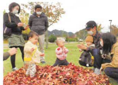
お父さんプログラム 「うたあそび」