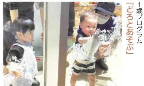
1歳プログラム 「うたあそび」