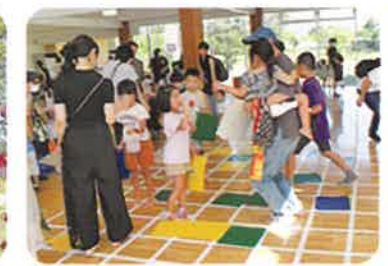
ますますジャンケン