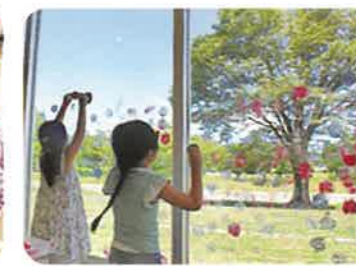
つながるスタンプ