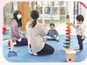
音・楽器をたのしんでもらえます。 同じ年齢の子を持つお母さん同士、 いろいろな情報交換ができそうです。