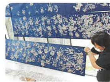
あつまっ手・つながっ手