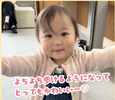
よちよち歩けるようになって とってもかわいい♡