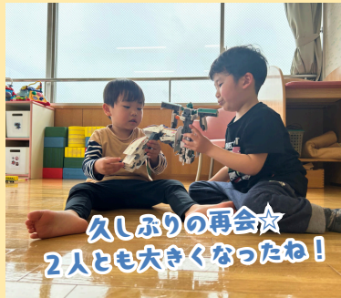
久しぶりの再会☆ 2人とも大きくなったね！