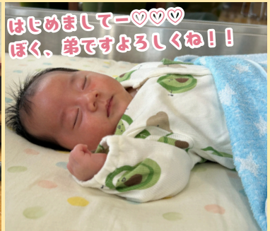
はじめまして♡♡♡ ほく、弟ですよろしくね！！