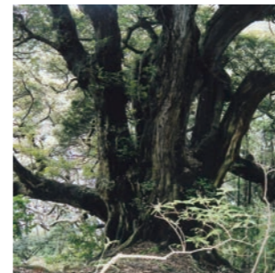
成生岬のスダジイ巨木

また、青葉山には固有植物である「オオキンレイカ」(市指定天然記念物)、大浦半島の成生岬には日本最大級の「スダジイ巨木」(市指定天然記念物、幹周13.8m・主幹9.5m)、神崎の海岸線には「ハマナス」が自生。舞鶴はまさに自然の宝庫といえます。