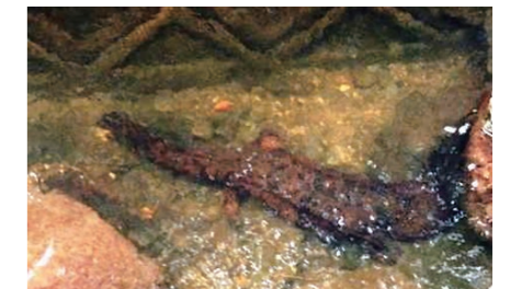
オオサンショウウオ