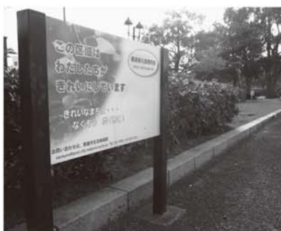
アダプト・プログラムの サインボード（しおじブラザ）