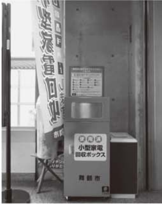
小型家電回収ボックスを設置

この「ごみ分別ルールブック&ごみ収集カレンダー」では、可燃ごみと不燃ごみの分別や排出方法、ごみ処理に関連する制度等を詳しく紹介しています。