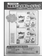
ごみ分別 ルールブック