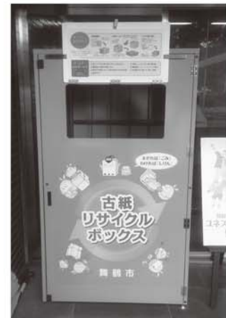
古紙回収ボックスを設置

平成28年度は、分別収集、清掃事務所への直接搬入、古紙ボックスによる回収と合わせて1,430 トン でした。