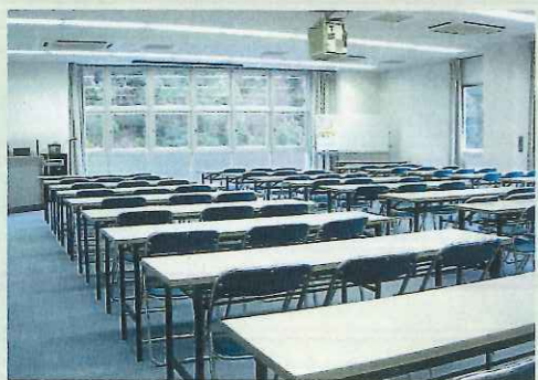
▲リサイクル学習室