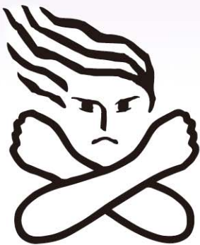
女性に対する暴力根絶の ためのシンボルマーク

暴力は、その対象の性別や加害者、被害者の間柄を問わず、決して許されるものではありません。特に、夫やパートナーからの暴力、性犯罪、ストーカー行為、セクシュアル・ハラスメント等の女性に対する暴力は、女性の人権を著しく侵害する行為です。