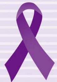
女性に対する暴力根絶の シンボル・パープルリボン

パープルリボンには、「あなたは一人ではないよ!」と励ますメッセージがこめられています。