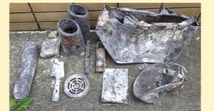
業務用の調理器など