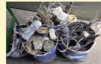
大量の番線・スプレー缶など