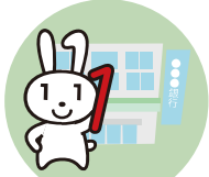
銀行・証券 口座開設