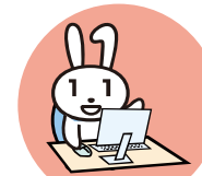
行政機関からの お知らせ・各種証明書