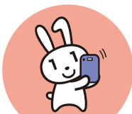
確定申告 (2024年度より)