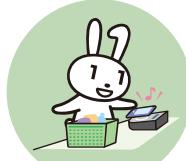
キャッシュレス 決済申込