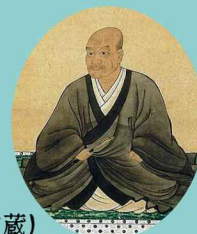
里村紹巴像 (東京国立博物館蔵)