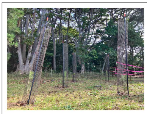
◀令和7年度事業 松原神社(三浜)周辺に松の木を植樹