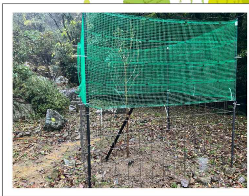
◀令和6年度事業 観音寺周辺に桜の木を植樹