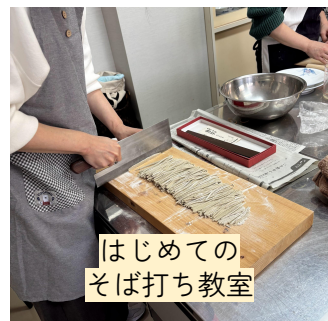
はじめての そば打ち教室