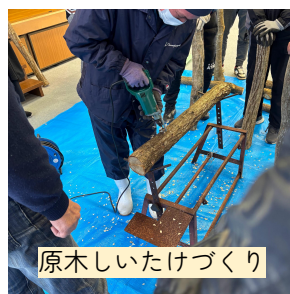
原木しいたけづくり