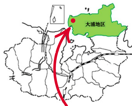
(株)農業法人ふるる