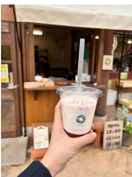
ガーデンカフェふるるの丘