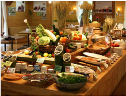
農村レストランふるる