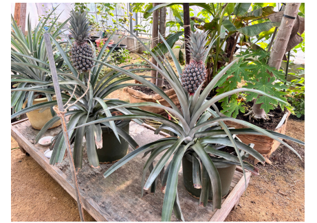
温室で育てているパイナップル