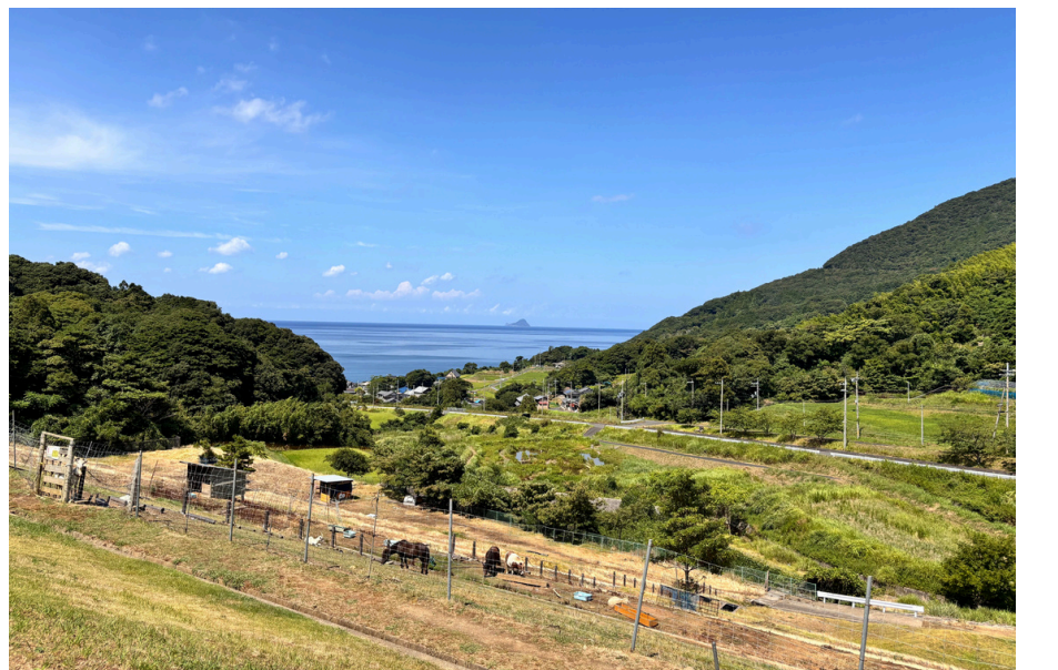
ふるるファームから眺める舞鶴の海