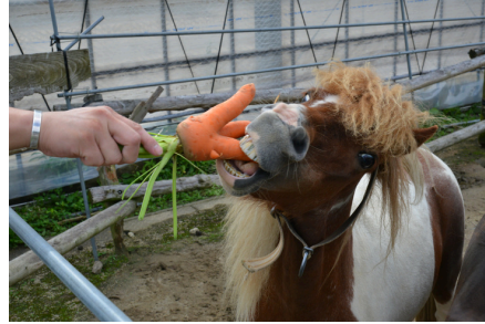
触れ合えるポニー