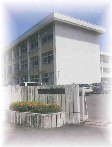
舞鶴市立中舞鶴小学校 舞鶴市字余部上一二〇

本市教育振興大綱には、「夢に向かって将来を切り拓く子ども」という一節がある。本校区ではこれを「志」ということばとしてとらえる。自己を客観的に見、現実をとらえ、ねばり強く歩み続ける心と能力を持つことを指して「志」の一文字を当てたい。「志」を育んでこそ、自らを律し、自立に向けて努力できる児童生徒を育てることができる。