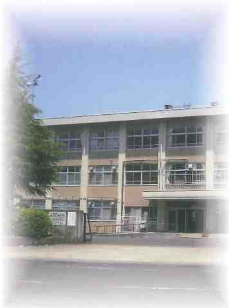
舞鶴市立和田中学校 舞鶴市字和田六四〇の四