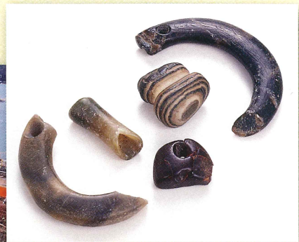
浦入遺跡出土 玉類