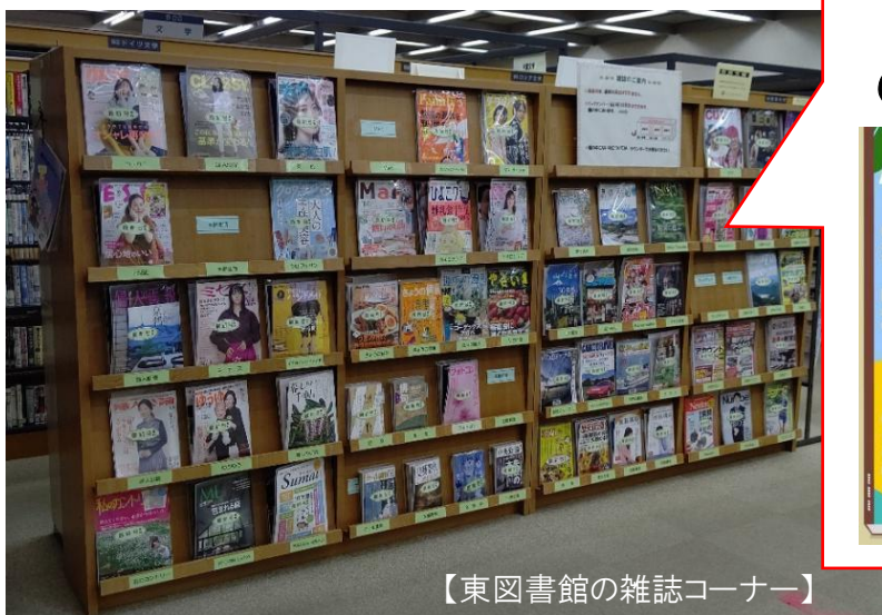
【東図書館の雑誌コーナー】