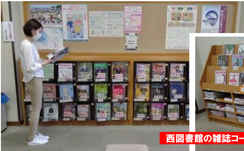
西図書館の雑誌コーナー